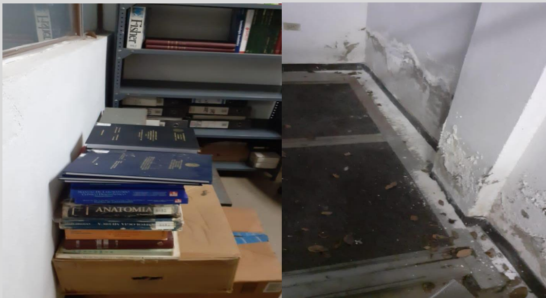
Imágenes del mal estado de la biblioteca del 12 de marzo de 2022.

la Escuela de Estudios Políticos de la UCV, en junio de 2021 177 , la cual se encuentra al lado de la Escuela de Bioanálisis.