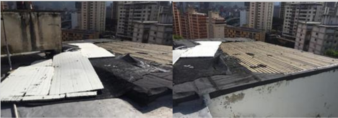
Daños en techos por filtraciones en el CENDES - UCV. Fecha: enero de 2022.

177. El CENDES - UCV está ubicado fuera del campus de la UCV y presenta filtraciones en techo y paredes, por la falta de impermeabilización; humedad y proliferación de bacterias en el material bibliográfico; robo de equipo de computación y falta de vigilancia 175 .