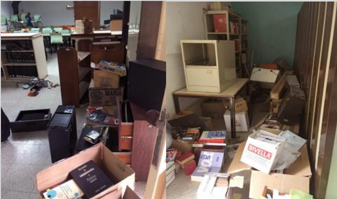
Imágenes de la Biblioteca de Idiomas Modernos de la UCV. Fecha: noviembre de 2021.