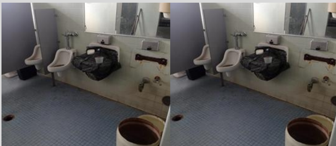
Biblioteca Central de la UCV con una tubería en mal estado y filtraciones